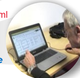
Utilisation du Numérique