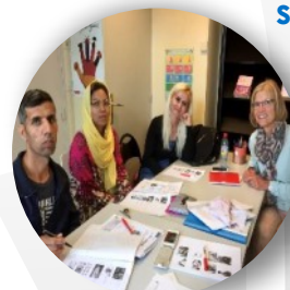
Français Langue Étrangère