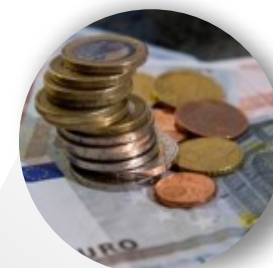
Argent au quotidien