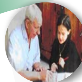
Aide à la scolarité