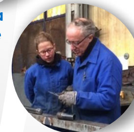
Maintien des savoirs de base